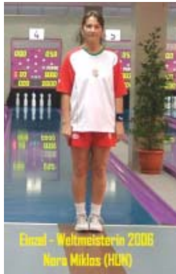
Einzel - Weltmeisterin 2006 Nora Miklos (HUN)